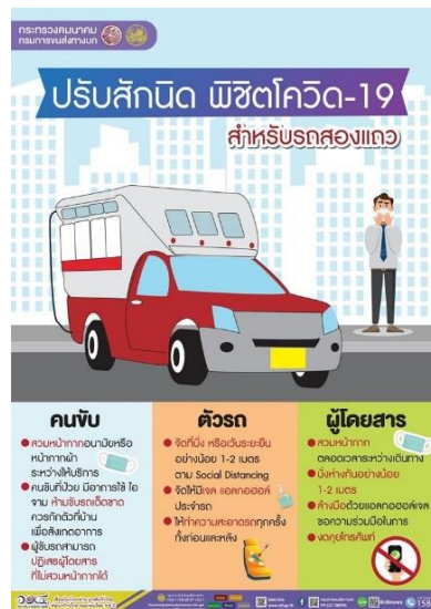
ภาพที่ 14 ปรับสัณนิท พิซิทโควิด - 19 สำหรับรถสองแถว

โดยกรมการขนส่งทางบกก็ได้มีการออกมาตรการ “ปรับสัณนิท พิซิทโควิด - 19” สำหรับการโดยสารรถบริการสาธารณะ เพื่อบริการประชาชนในการใช้บริการ เพื่อเป็นการป้องกันและควบคุมการแพร่ระบาดของไวรัสโควิด - 19 มาตรการต่าง ๆ ที่ออกโดยภาครัฐและการสนองนโยบายของภาครัฐ ทั้งโดยภาครัฐเองหรือภาคเอกชนก็ดี ต่างมีจุดประสงค์เพื่อการป้องกันการแพร่ระบาดของเชื้อไวรัสโควิด - 19 ให้ประชาชนเข้าใช้บริการที่ต่าง ๆ อย่างปลอดภัย