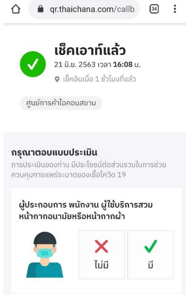
ภาพที่ 9 ขั้นตอนการเช็คอิน 5