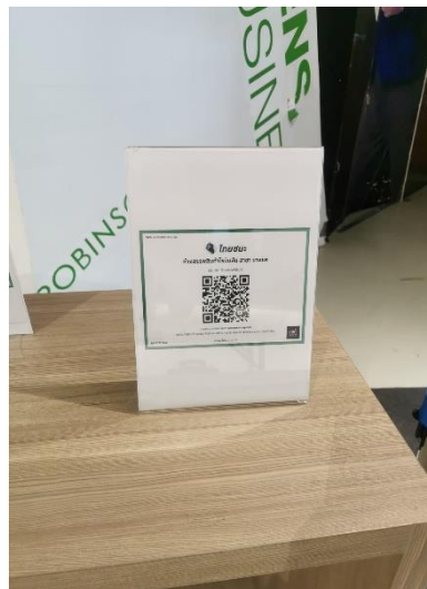
ภาพที่ 6 ขั้นตอนการเช็คอิน 2