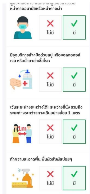
ภาพที่ 10 ขั้นตอนการเช็คอิน