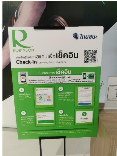
ภาพที่ 5 ขั้นตอนการเช็คอิน 1

ระบบลงทะเบียนที่ชื่อว่า “ไทยชนะ” ( www.ไทยชนะ.com ) โดยมีการบริการจุดสแกน QR Code บริเวณห้างสรรพสินค้าและร้านค้าต่าง ๆ เพื่อให้ผู้เข้าใช้บริการสแกนก่อนเข้ารับบริการ (ไทยชนะ, 2563) โดยมีขั้นตอนดังนี้