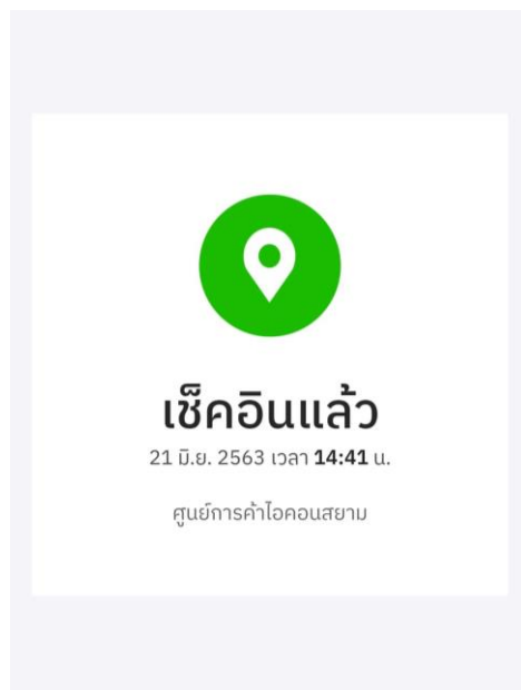
ภาพที่ 8 ขั้นตอนการเช็คอิน 4