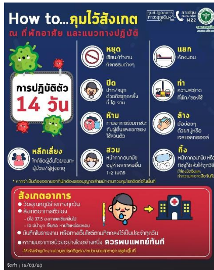
ภาพที่ 4 How to...คุมไว้สังเกต ณ ที่พักอาศัย และแนวทางปฏิบัติ

รวมถึงการสังเกตอาการของตนเองและบุคคลภายใต้ความดูแลของตนว่ามีอาการอย่างไร อยู่ในกลุ่มเสี่ยงหรือไม่ การเว้นระยะห่างระหว่างกัน ควรเว้นอย่างน้อย 1 เมตร เพื่อความปลอดภัย วิธีการดูแลตัวเอง และรวมถึงวิธีการรักษาตัว เมื่อติดเชื้อไวรัสโควิด - 19 อย่างมากมาย แพร์ทลาย (กรมควบคุมโรค, 2563) และมาตรการระดับภาครัฐในการป้องกันการแพร่ระบาดของไวรัสโควิด - 19 อาทิเช่น การออกประกาศสถานการณ์ฉุกเฉินทั่วราชอาณาจักรตามพระราชกำหนดการบริหารราชการในสถานการณ์ฉุกเฉิน หรือ พรก.ฉุกเฉิน โดยพลเอกประยุทธ์ จันทร์โอชา นายกรัฐมนตรี ในวันที่ 25 มีนาคม 2563 โดยเริ่มการใช้พระราชกำหนดการบริหารราชการในสถานการณ์ฉุกเฉิน หรือ พรก.ฉุกเฉิน ตั้งแต่วันที่ 26 มีนาคม 2563 เป็นต้นไป เพื่อควบคุมการระบาดของไวรัสโคโรนา หรือโควิด-19 โดยระยะแรก การห้ามออกนอกเคหสถาน ให้การห้ามบุคคลใดที่ทั่วราชอาณาจักรออกนอกเคหสถาน ระหว่างเวลา 22.00 นาฬิกา ถึง 04.00 นาฬิกา การห้ามหรือข้อจำกัดการดำเนินการหรือการทำกิจกรรมบางอย่างตามพระราชกำหนดและกฎหมายอื่นที่เกี่ยวข้อง (THE STANDARD TEAM, 2563) และในวันที่ 15 พฤษภาคม 2563 มีการปรับเปลี่ยนระยะเวลาเคอร์ฟิวจากเดิม 22.00 - 04.00 นาฬิกา เป็น 23.00 - 04.00 นาฬิกา วันรุ่งขึ้น คือ ลดลง 1 ชั่วโมง ส่วนห้างสรรพสินค้า ต้องปรับเวลาเปิด-ปิดเป็น 10.00 - 20.00 นาฬิกา โดยวันที่ 17 พฤษภาคม 2563 ได้มีการเปิดห้างสรรพสินค้าให้บริการอย่างเต็มระบบ แต่จะเว้นในส่วนของสวนสนุก เครื่องเล่นต่าง ๆ และมีการควบคุมการเข้าและออกห้างอย่างสม่ำเสมอ มีการทำความสะอาด การตรวจวัดไข้ก่อนเข้าใช้บริการ และมีการลงทะเบียนก่อนเข้ารับบริการทั้งห้างสรรพสินค้าและร้านค้าต่าง ๆ ผ่าน