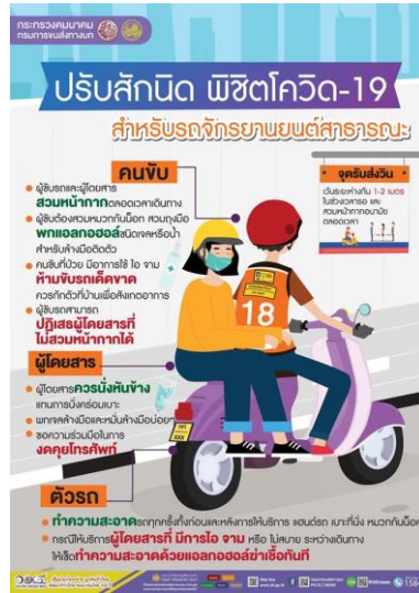
ภาพที่ 13 ปรับสัณนิท พิซิทโควิด - 19 สำหรับรถจักรยานยนต์สาธารณะ