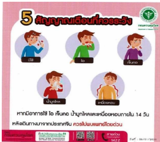
ภาพที่ 1 5 สัญญาณเตือนที่ควรระวัง