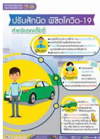
ภาพที่ 11 ปรับสัณนิต พิชิตโควิด - 19 สำหรับรถแท็กซี่

ซึ่งการลงทะเบียนผ่านเว็บไซต์ไทยชนะเป็นการเก็บข้อมูลการใช้งานพื้นที่ภายในชุมชน เพื่อเป็นการวิเคราะห์ข้อมูลผลจัดการข้อมูลของผู้ใช้บริการพื้นที่สาธารณะอย่างเป็นระบบ โดยระบบนี้ออกแบบโดยกระทรวงสาธารณสุข โดยเข้าทางเว็บไซต์ www.ไทยชนะ.com หรือสแกน QR Code (ไทยชนะ, 2563) ที่ห้างสรรพสินค้าหรือร้านค้าต่าง ๆ จัดเตรียมไว้ให้ โดยสแกนและลงทะเบียนข้อมูลส่วนบุคคล เพื่อระบบจะทำการจัดเก็บข้อมูลของผู้เข้าใช้บริการ และเมื่อใช้บริการเสร็จก็ต้องสแกน QR Code เช็คเอาท์ ออกจากร้านค้าต่าง ๆ พร้อมทั้งระบบยังมีแบบประเมินการให้บริการ ในด้านการรักษาความสะอาด การป้องกันเชื้อไวรัสโควิด - 19 ของห้างสรรพสินค้าหรือร้านค้าต่าง ๆ ที่เข้าใช้บริการ (ไทยชนะ, 2563) และนอกจากนี้ยังมีมาตรการในการป้องกันในหลากหลายด้าน อาทิเช่น การใช้บริการและให้บริการสาธารณะ