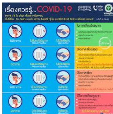
ภาพที่ 3 เรื่องควรรู้...COVID - 19

ในประเทศไทยมีการป้องกันการแพร่ระบาดหลากหลายวิธี โดยทางรัฐบาล โรงพยาบาล หน่วยงานต่าง ๆ ในประเทศไทยทั้งภาครัฐและเอกชน ต่างผลิตสื่อที่เกิดกับไวรัสโควิด - 19 ออกมา เพื่อให้ความรู้แก่ประชาชน ทั้งทางสื่อออนไลน์และการให้ความรู้ในสถานที่ต่าง ๆ ถึงไวรัสนี้และวิธีการปฏิบัติตน เมื่อต้องเข้าสู่ที่สาธารณะ เพื่อป้องกันตนเองและป้องกันบุคคลรอบข้างภายในสังคม ทั้งสื่อออนไลน์ที่เผยแพร่ทางอินเทอร์เน็ต Facebook, Line, Google ฯลฯ เพื่อให้ความรู้ที่เกี่ยวกับไวรัสโควิด - 19 วิธีการป้องกัน เช่น ควรปฏิบัติตนอย่างไรเมื่อเข้าสังคม หรือเข้าสู่สาธารณะ วิธีใส่หน้ากากอนามัยอย่างถูกต้อง การล้างมืออย่างถูกวิธีทั้งการใช้เจลแอลกอฮอล์และสบู่ล้างมือ (มหาวิทยาลัยราชภัฏบุรีรัมย์, 2563)