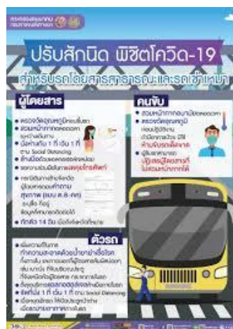
ภาพที่ 12 ปรับสัณนิต พิชิตโควิด - 19 สำหรับรถโดยสารสาธารณะและรถเช่าเหมา