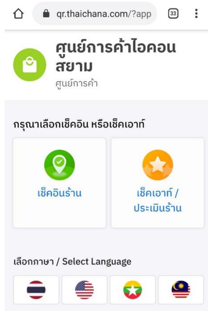
ภาพที่ 7 ขั้นตอนการเช็คอิน 3